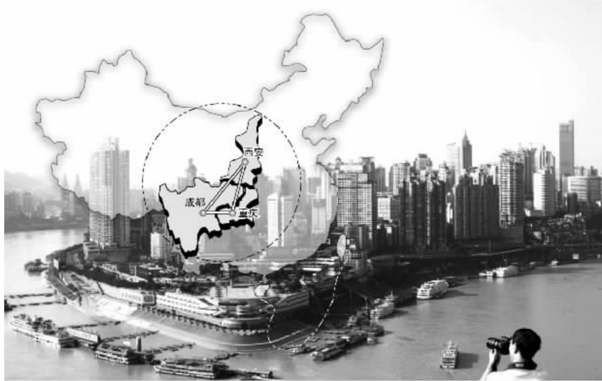
重庆、成都、西安有望在我国西部地区形成一个全新的西三角经济圈 张大伟 制图