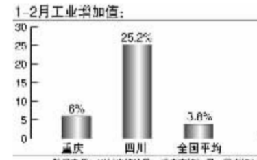
1-2月,无论是固定资产投资还是工业增加值,重庆和成都的数据均跑赢了全国平均水平 张大伟制图